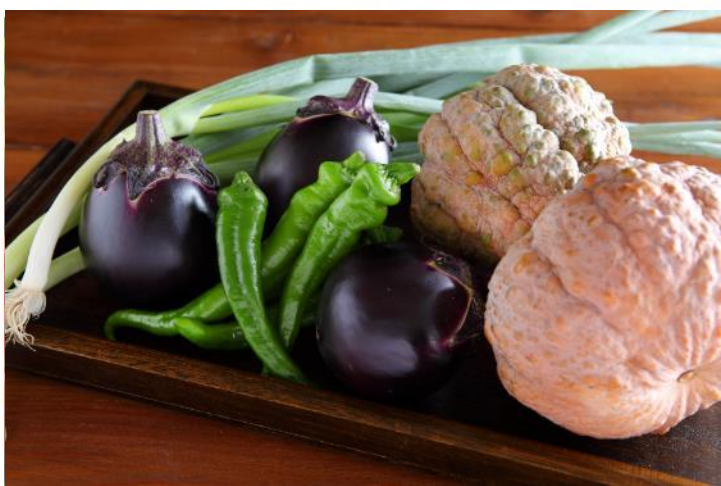
料理を通して、農業への興味・理解の促進

料理(つくること)・食事(たべること)を通じて、地域のみなさまに、農業の素晴らしさ・地産地消の素晴らしさを実感していただけます。