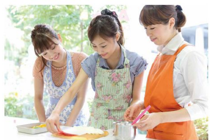
地元食材を使った料理メニューの発信