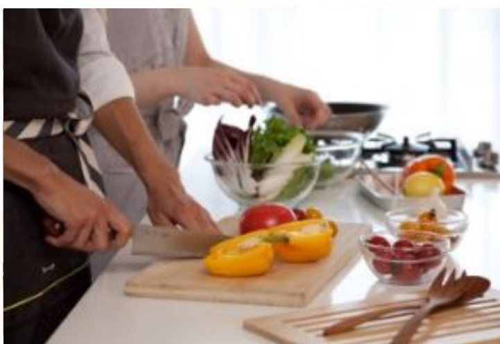
一般の新たな利用者の創出