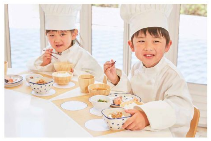
誰かと作ったり、食べたりする 楽しみの場を提供