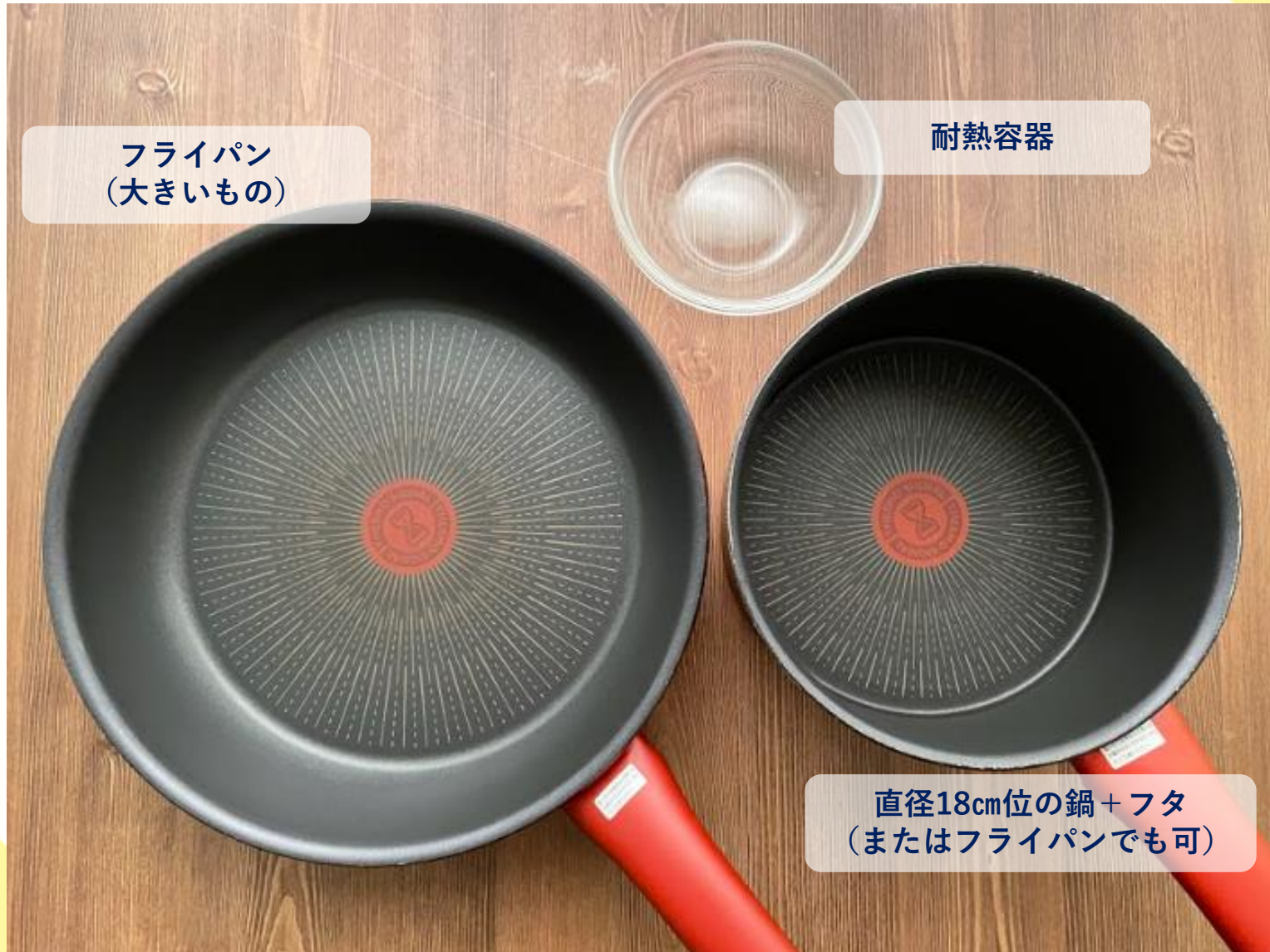
フライパン (大きいもの)